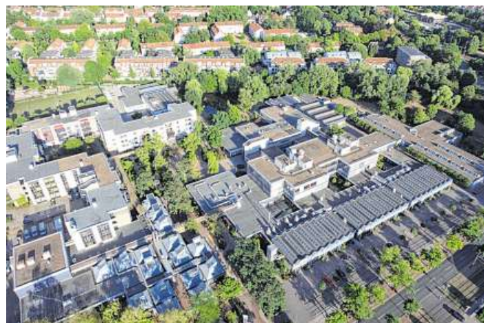
Seit August gibt es neben dem Standort des Berufsbildungswerks in Bremen (links) auch einen in Bremerhaven.